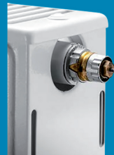
Gewindeanschluss an Ventilheizkörpern