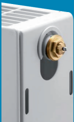
Gewindeanschluss an Ventilheizkörpern