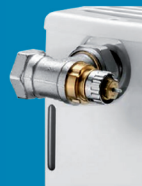
Gewindeanschluss an konventionellen Heizkörpern