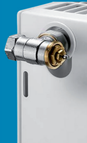
Gewindeanschluss an konventionellen Heizkörpern