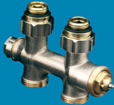
FORtech Anschlussarmatur Multiblock T für Heizkörper mit Rp 1/2" IG Durchgangsform