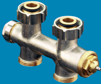
FORtech Anschlussarmatur Multiblock T für Heizkörper mit G 3/4" AG Durchgangsform