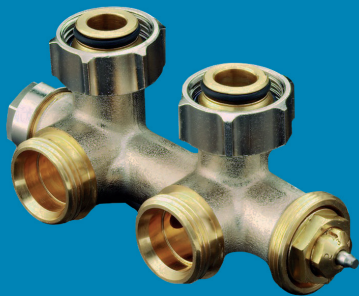
FORtech Anschlussarmatur Multiblock T für Heizkörper mit G 3/4" AG Eckform