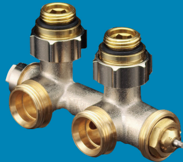
FORtech Anschlussarmatur Multiblock T für Heizkörper mit Rp 1/2" IG Eckform